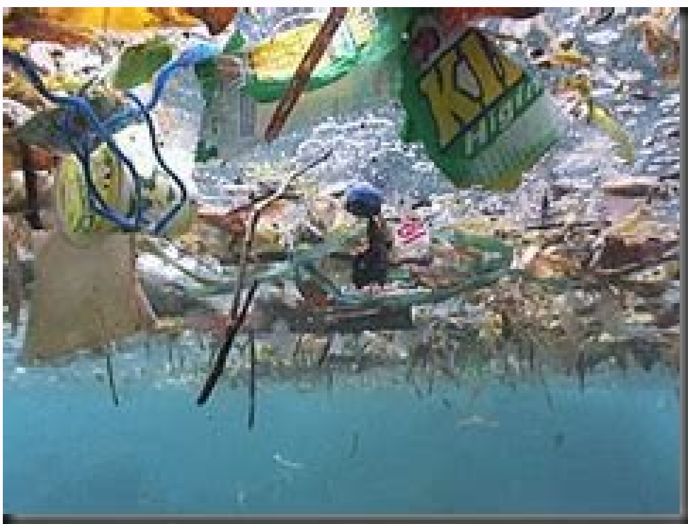
Urj em grandes depositos de lixo varios gases. Em grandes depositos de lixo varios gases sao queimados continuamente.